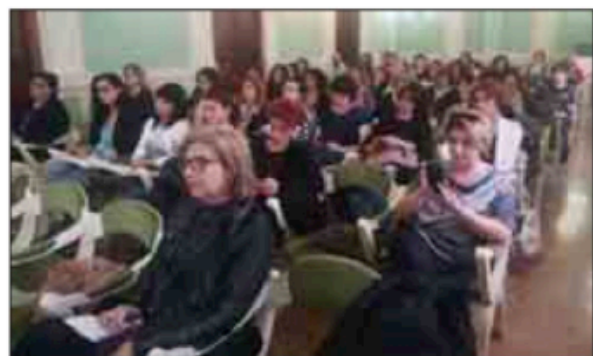
Alcuni momenti dell'incontro in Camera di Commercio